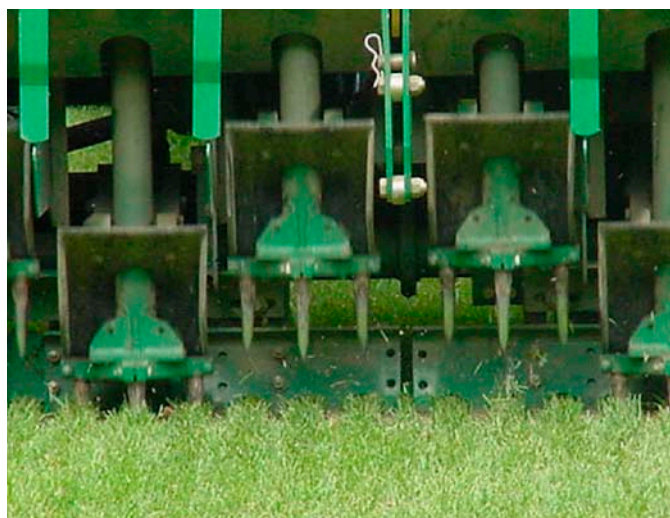
La aireación con púas solidas es una buena forma de mejorar las condiciones durante la temporada ya que causa un disturbio mínimo en la superficie, pero no debe ser utilizado como sustitución de la aireación con púas huecas (saca